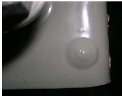
Figure 4.2: Saillie de contact

Chaque roue dispose d'une saillie sur la partie en contact avec le chariot du transformateur (figure 4.2). Elle sert à coupler l'ensemble au trou de M8 du chariot du transformateur nécessaire pour le déplacement dans le sens longitudinal ou transversal.