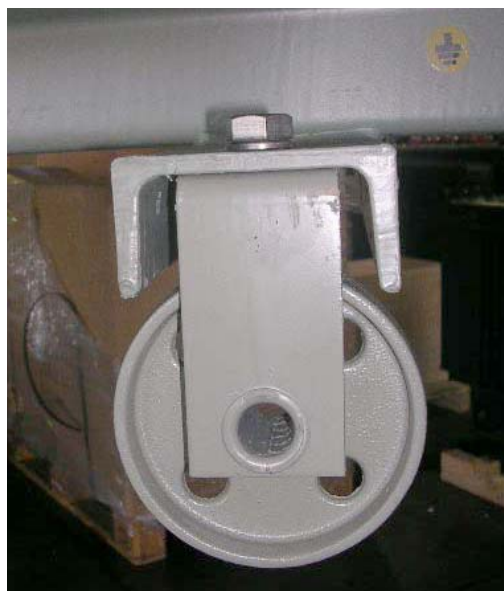
Figure 4.3: Position de roue pour déplacement longitudinal

Serrer la vis de manière la saillie sur la figure 4.2 soit emboîtée dans le trou du chariot du transformateur.