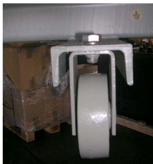
Figure 4.4: Position de roue pour déplacement transversal

Serrer la vis de manière la saillie sur la figure 4.2 soit emboîtée dans le trou du chariot du transformateur.