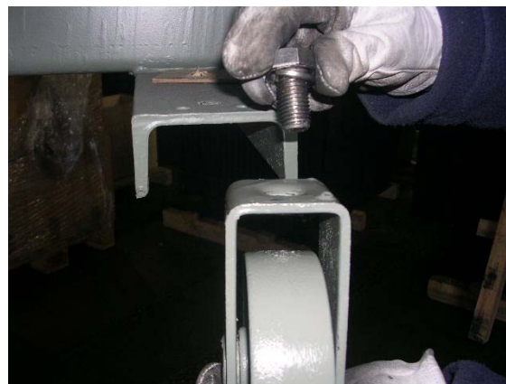
Figure 4.1: Fixation de la vis M16

Fixer la vis dans le trou de M16 de chaque chariot du transformateur, la rondelle doit être sur la partie supérieure et la roue dessous (voir figure 4.1).